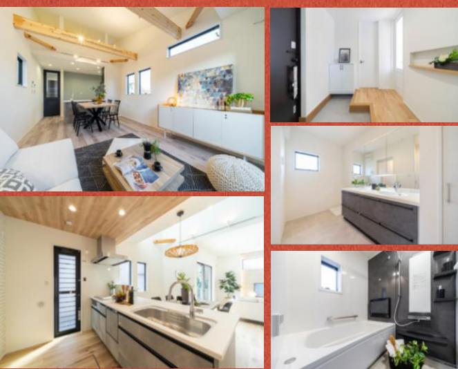
※上記内観写真は全て売主施工例です。